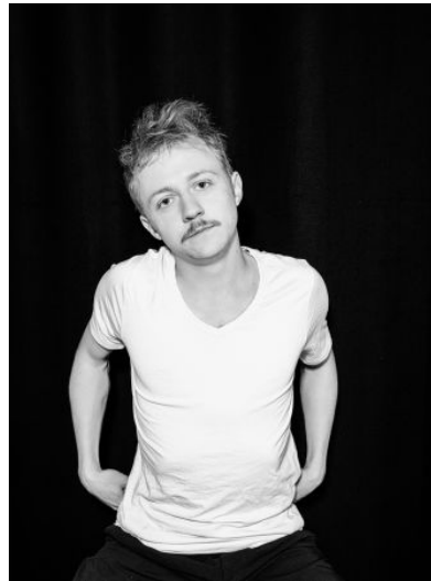
© Nikolett Kustos Studios | 07.2023