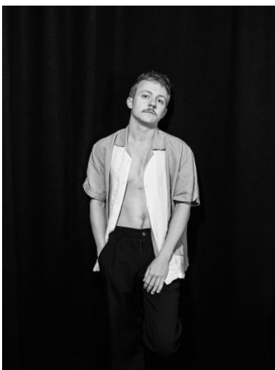
© Nikolett Kustos Studios | 07.2023