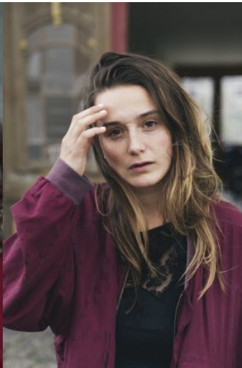
© Isabel Machodo Rios | 2019